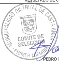
PEDRO LANDA SALAZAR PRIMER MIEMBRO