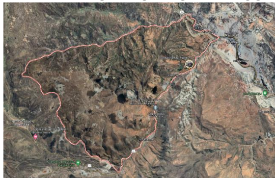
MAPA SATELITAL DISTRITAL DE SANTA ROSA DE SACCO