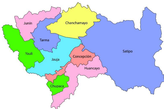
MAPA PROVINCIAL DE YAULI