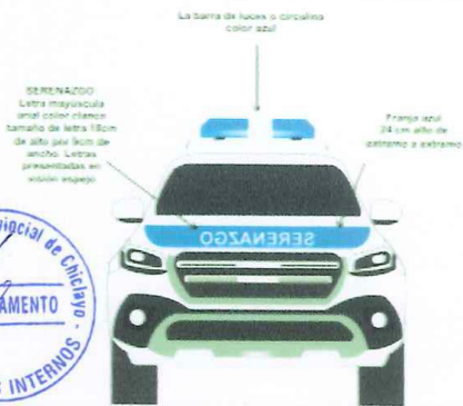
GRÁFICO N° 22 - POSTERIOR