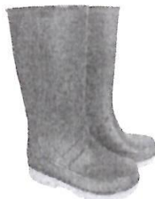
Botas de Jefe