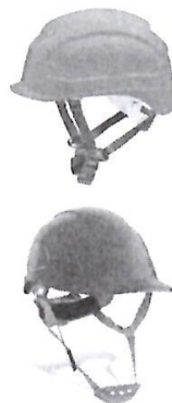
Casco de Seguridad