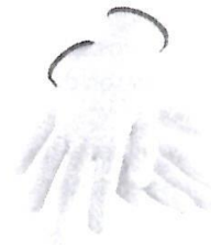
Guantes de Seguridad de Obra