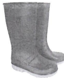
Botas de Jebe