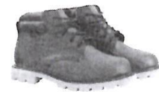
Botines cortos de Jebe