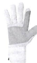
Guantes de Seguridad de Obra