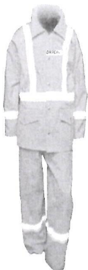
Uniforme de Mantenimiento

"AÑO DE LA RECUPERACIÓN Y CONSOLIDACIÓN DE LA ECONOMÍA PERUANA"