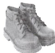
Zapatos de Seguridad con Puntera de Acero