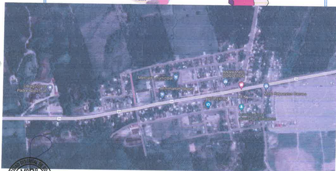
Ilustración 2. Localización del proyecto vía satelital