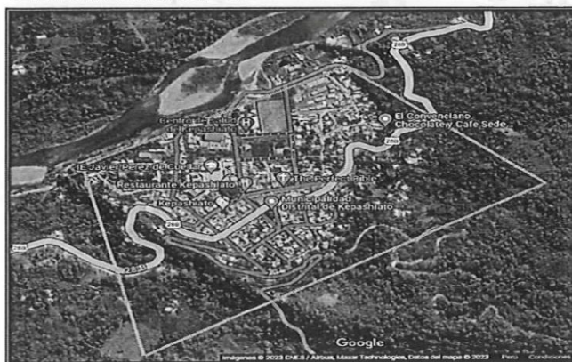
Fig. 1: