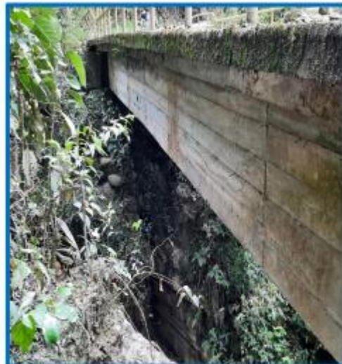
PUENTE EL LAUREL