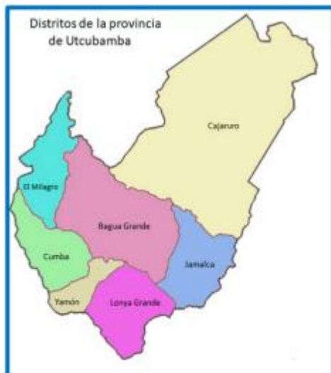
DISTRITO DE JAMALCA