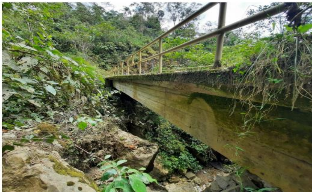
Ilustración 7 Estado actual del puente EL LAUREL

En la actualidad el puente existente se encuentra deteriorado debido a su falta de mantenimiento; las estructuras de apoyo del puente EL LAUREL ha sufrido socavación a causa de las fuertes avenidas de la quebrada, dicho puente tiene varios años de antigüedad, los estribos están compuestas muro de concreto armado, la superficie de rodadura está compuesta vigas y losa deteriorados. Las condiciones del puente provocan el apartamiento entre los centros poblados aledaños al distrito de Jamalca, el puente de concreto armado proyectado se ubicará en el lugar que se aprecia en la imagen siguiente, debido a que cuenta con accesos para transporte vehicular.