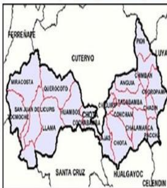
Figura 02: Ubicación Distrital