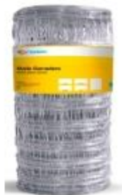
Imagen 1 (Acabado de rollo compactado)

Av. Manuel Olgüin N° 211, Oficina 1703, Santiago de Surco – Lima Celular N° 966 886 430