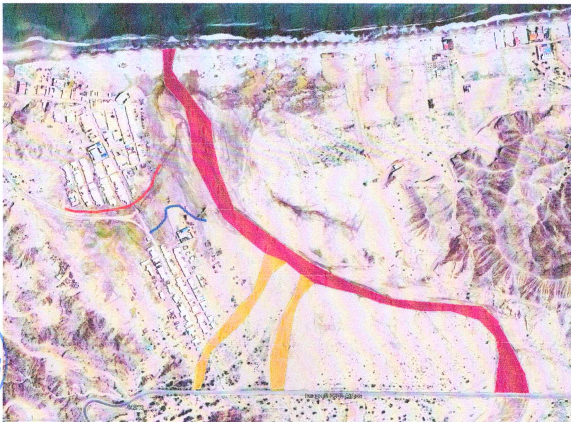
Ilustración 2. Ubicación del proyecto en caleta el Ñuro.