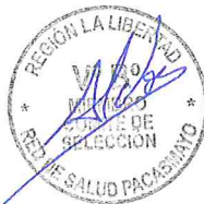
----- Segundo Miembro Titular