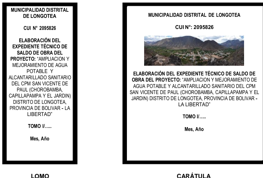
Figura 1. Forma de presentación del Expediente

El contenido máximo de folios por cada archivador será de 200 páginas, salvo cuando el límite obligará a dividir escritos o documentos que constituyan un solo requisito, en cuyo caso se mantendrá su unidad. Por ejemplo, un solo requisito puede ser el Estudio de Mecánica de Suelos, o el Manual de Operación y Mantenimiento. En esos casos, estos documentos no deberán ser divididos en diferentes tomos, deben mantenerse en uno solo.