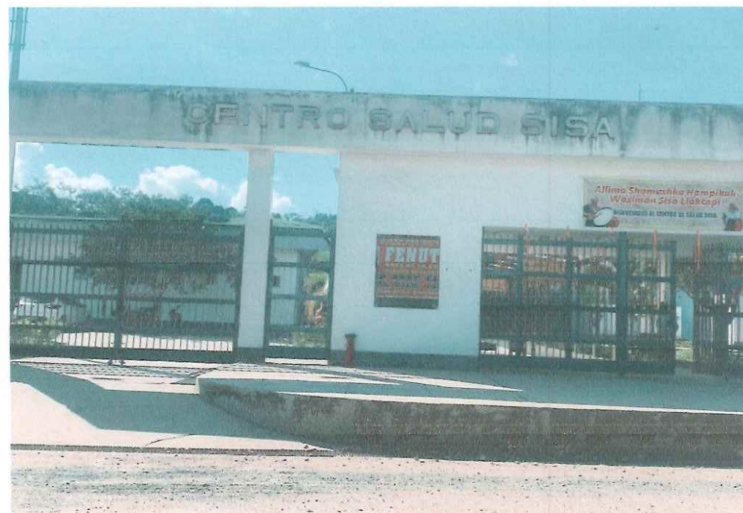
En la imagen tomada en junio de 2024, se puede apreciar el estado en el que se encuentra los exteriores del Centro de Salud.