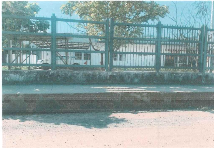
En la imagen tomada en junio de 2024, se puede apreciar el estado en el que se encuentra el cerco perimétrico (parte metálica) del Centro de Salud.