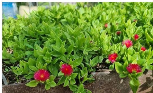
Mesembryanthe mum Cordifolium (Aptenia cubresuelo verde)