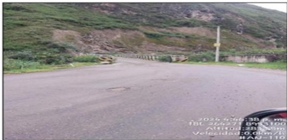
IMAGEN N°02: Fin Coordenadas UTM de Ubicación