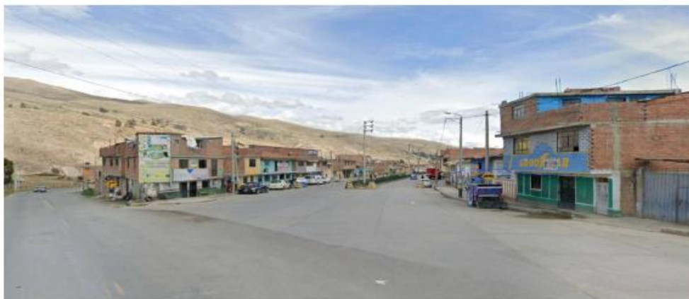
Fuente: Google Earth - Información Espacial SINAC (D.S. N° 011-2016-MTC)