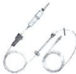
Fig. 1.: Línea para Bomba de Infusión sin Volutrol (No implica diseño)