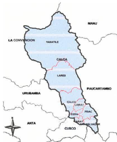
MAPA 02: Ubicación Geográfica Distrito de Yanatile Fuente: Unidad Formuladora Municipalidad Distrital de Yanatile