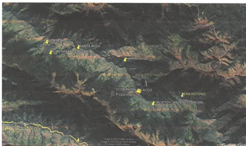
MAPA 04. Mapa del área de influencia del proyecto