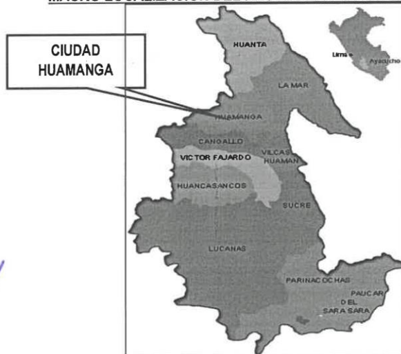
MAPA N.º 01: