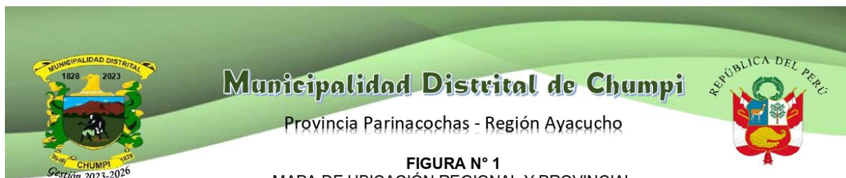
FIGURA N° 1 MAPA DE UBICACIÓN REGIONAL Y PROVINCIAL