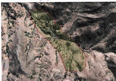
Imagen N° 01: Ubicación geográfica (coordenadas UTM) de la localidad a intervenir.