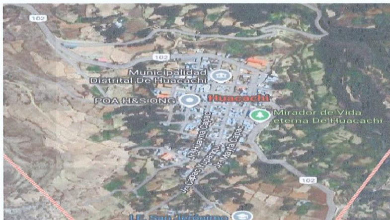
Lugar del proyecto.

El acceso a la localidad de la Merced desde la ciudad de Huaraz, se encuentra descrita según el cuadro que a continuación de detalla: