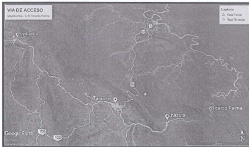
Imagen 2: Vista del Recorrido desde Moyobamba hasta la Comunidad Nativa Kewchua Ricardo Palma.

"Año del Bicentenario de la consolidación de nuestra independencia, y de la conmemoración de los héroes peruanos de Tumbes y Ayacucho"