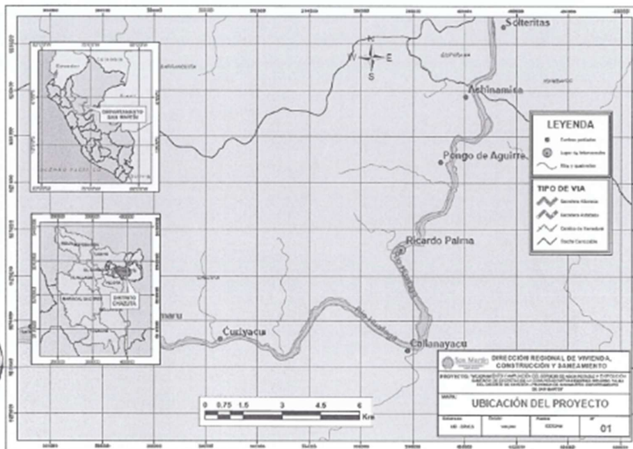
Imagen 1: Mapa Departamental, Provincial, Distrital y Local del Proyecto

"Año del Bicentenario de la consolidación de nuestra independencia, y de la conmemoración de las huestes banderas de Junín y Ayacucho"