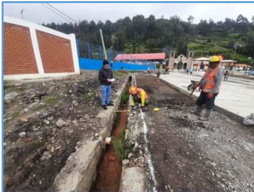
Foto 01: Se ve el Canal Principal en mal estado, además la llegada de drenaje del inicial.

"MANTENIMIENTO DEL CANAL EN LA LOCALIDAD DE AMPAS DEL CENTRO POBLADO DE AMPAS DEL DISTRITO DE HUARI, PROVINCIA DE HUARI, DEPARTAMENTO DE ANCASH"