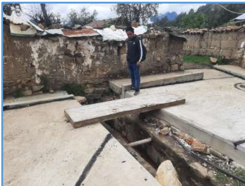
Foto 04: Se ve en mal estado el canal principal, además de que no hay vereda en el tramo del canal.

"MANTENIMIENTO DEL CANAL EN LA LOCALIDAD DE AMPAS DEL CENTRO POBLADO DE AMPAS DEL DISTRITO DE HUARI, PROVINCIA DE HUARI, DEPARTAMENTO DE ANCASH"