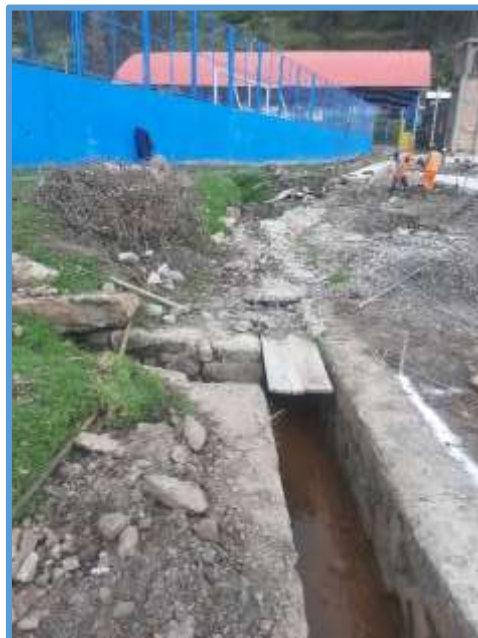
Foto 02: Se ve la unión del Canal Principal y Canal Secundario en mal estado.