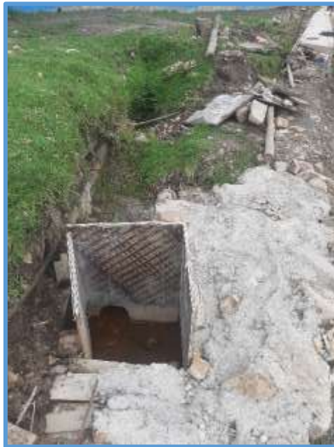
Foto 03: Se ve en mal estado la caja de unión existente entre drenaje del estadio y del campo deportivo.