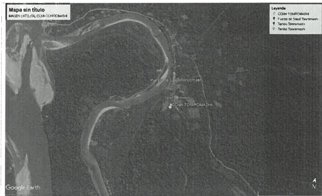
Figura 2: Vista satelital de la Comunidad Nativa TONIROMASHI.