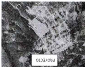
Ubicación del proyecto