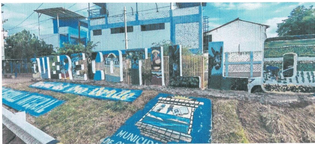
Gráfico N° 3: ingreso al centro poblado Ciudad de Querecotillo

El acceso al lugar, es a través de la carretera asfaltada Piura – Sullana – Carretera a Querecotillo.