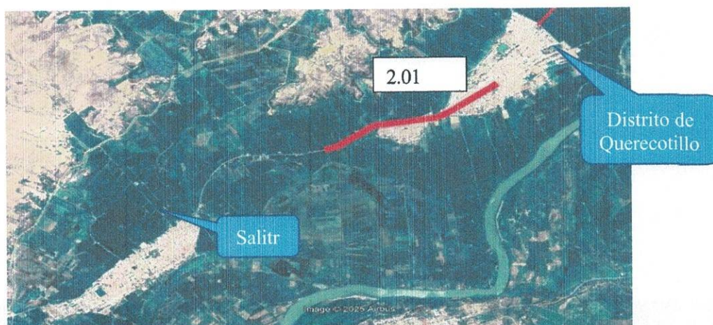
Gráfico N° 2: Localidades de área de influencia