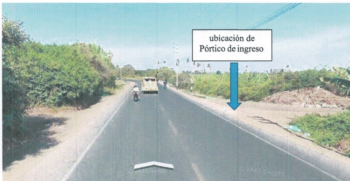
Gráfico N° 3: Ubicacion