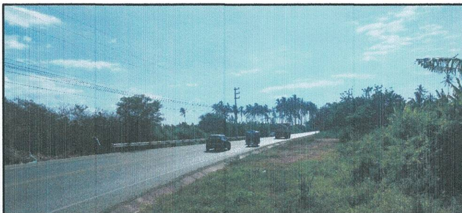
Gráfico N° 1: Condición actual del ingreso al distrito de Querecotillo