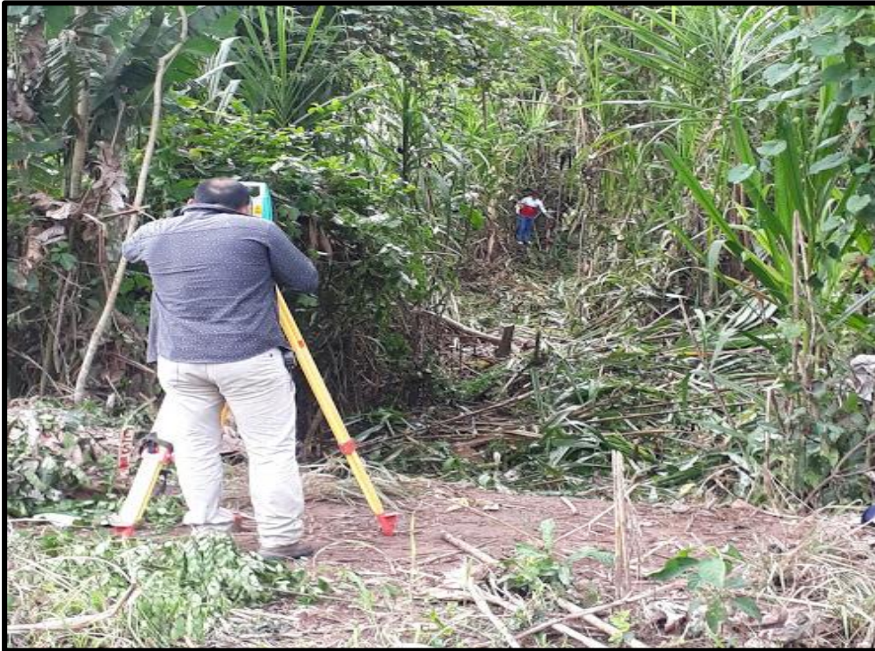
Fotografía N° 05: Vista preliminar de levantamiento del terreno para el proyecto de Residuos Sólidos.