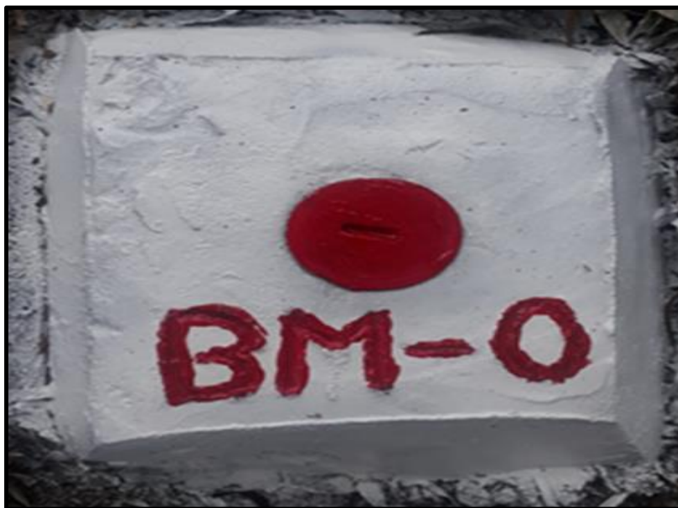
Fotografía N° 01: Punto de inicio en el BM-0 en el terreno para el proyecto.