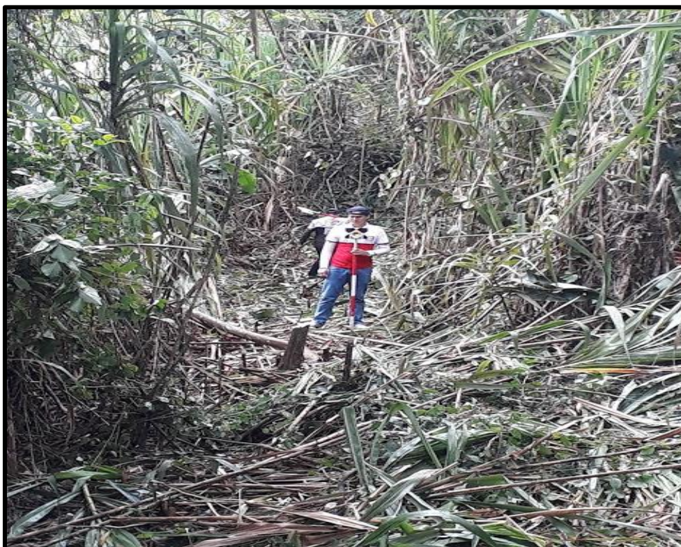
Fotografía N° 08: Vista preliminar de levantamiento del terreno para el proyecto de Residuos Sólidos.