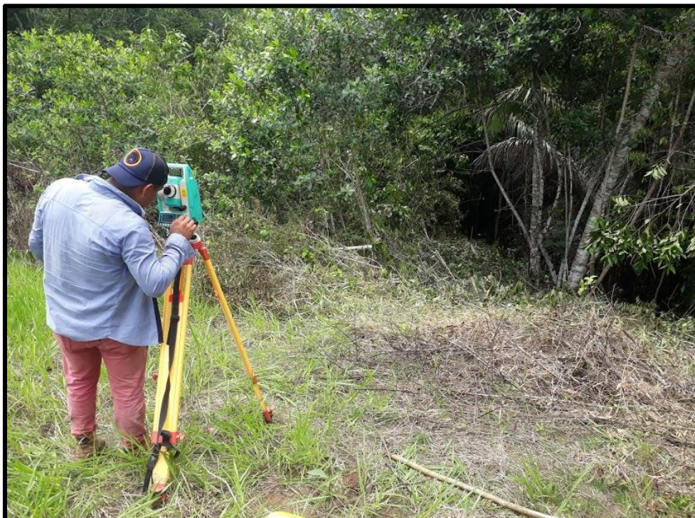
Fotografía N° 07: Vista preliminar de levantamiento del terreno para el proyecto de Residuos Sólidos.