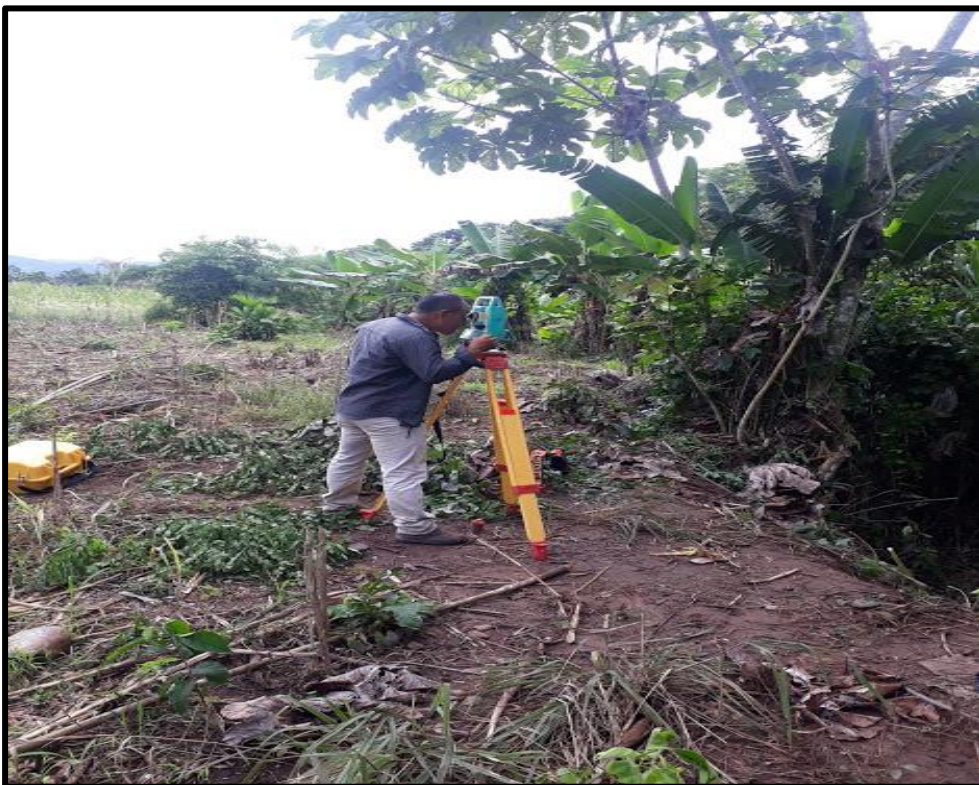
Fotografía N° 06: Vista preliminar de levantamiento del terreno para el proyecto de Residuos Sólidos.