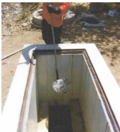
Cámara de rejas