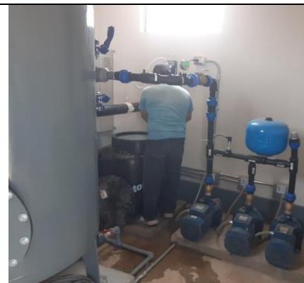
Electrobombas de agua tratada