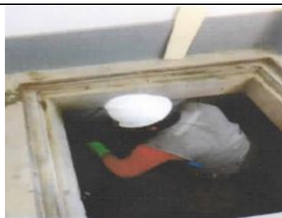
Cisterna agua tratada 20 m 3