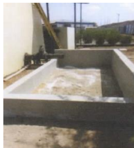
Lecho de secado