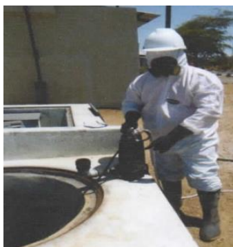
Cámara de bombeo