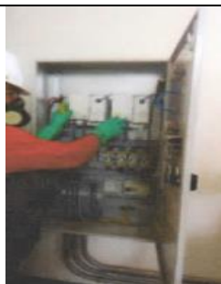
Tableros de control