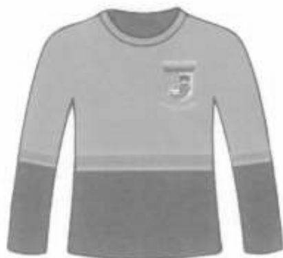
Polo manga larga cuello redondo Adelante