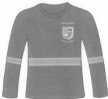
Polo manga larga cuello redondo Adelante