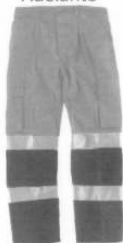
Pantalon Drill Adelante