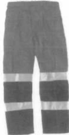
Pantalon Drill Adelante