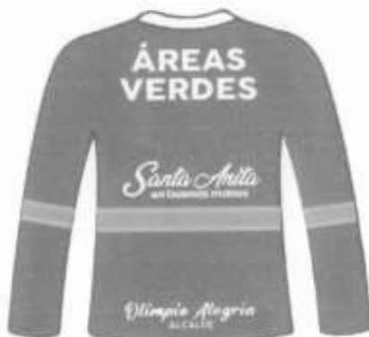
Polo manga larga cuello redondo Espalda