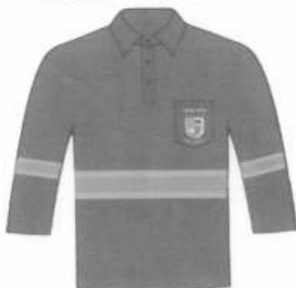
Polo manga Larga cuello camisero Adelante