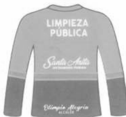
Polo manga larga cuello redondo Espalda