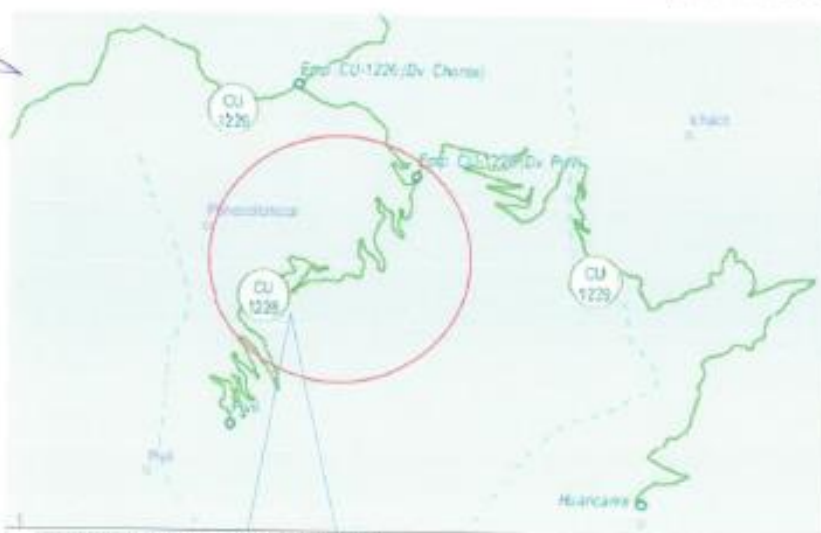
Camino Vecinal: Emp. Cu-1226 (Dv. Chonta) - Pivil

El contratista debe cumplir los siguientes requisitos: