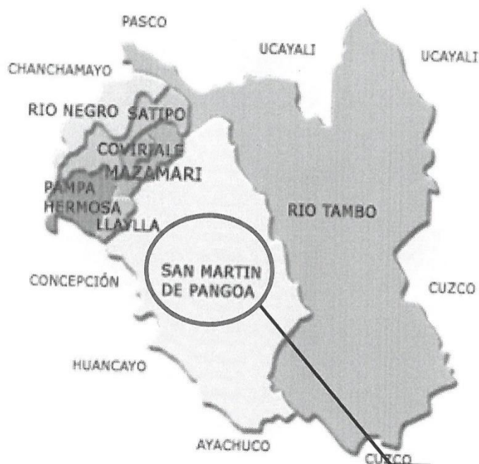
UBICACIÓN DEL PROYECTO