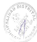
GRAFICO N° 01