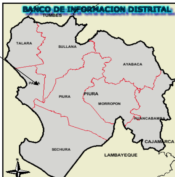
Esquema de Ubicación Geográfica en el Mapa de la Provincia de Paita.