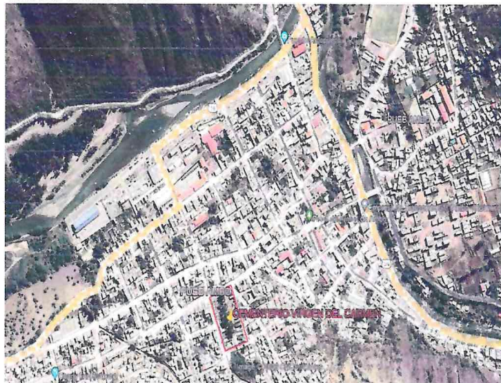
Ubicación Satelital del Predio