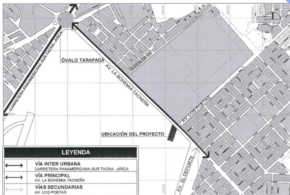
Figura 3. Vías de acceso al proyecto

Fuente. Base Catastral Plan de desarrollo Urbano distrital de Gregorio Albarracín Lanchipa Elaboración. Consultor