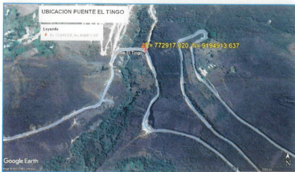
Imagen 01: Ubicación del Puente Tingo