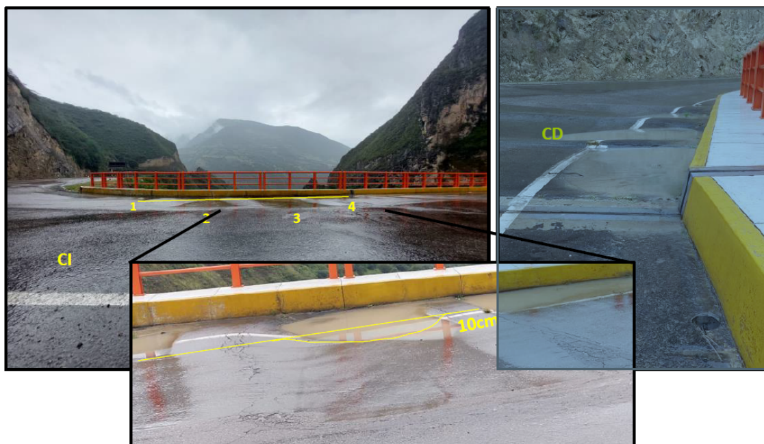
Figura 01. Corrugación

“Decenio de la Igualdad de Oportunidades para Mujeres y Hombres” “Año del Bicentenario, de la consolidación de nuestra Independencia, y de la conmemoración de las heroicas batallas de Junín y Ayacucho”