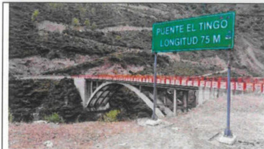
Imagen 02: Vista panorámica del Puente Tingo