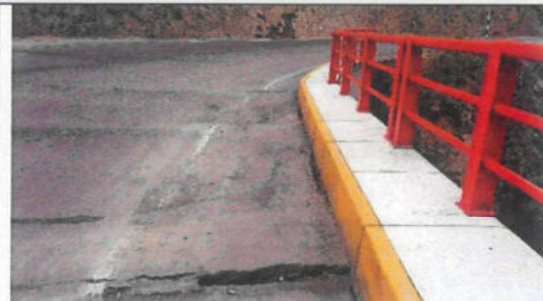
Imagen 03: Vista de la calzada a intervenir