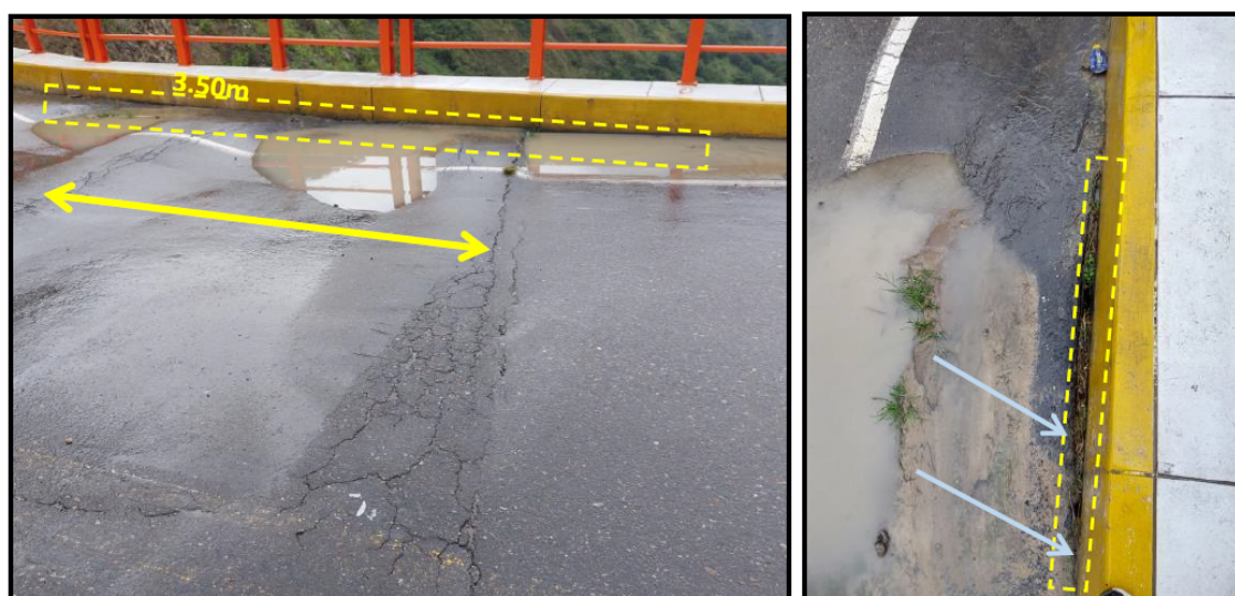
Figura 02. Corrugación con grietas