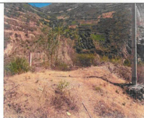
Imagen 05: Punto A 2 (GPS T-2, BM)