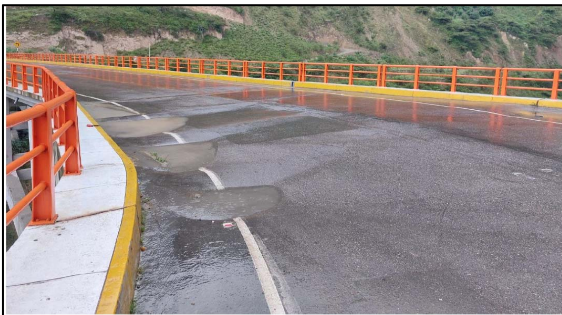
Figura 3. Empozamiento de agua.

ESTAS DEFORMACIONES DEBEN SER ELIMINADAS CON LA FINALIDAD DE REPARAR LA CALZADA DEL ACCESO IZQUIERDO DEL PUENTE EL TINGO Y ASI RESTABLECER LAS MISMAS CONDICIONES QUE CUANDO FUE CONSTRUIDO.