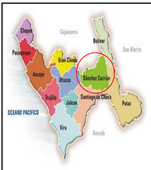
PROVINCIA SANCHEZ CARRION