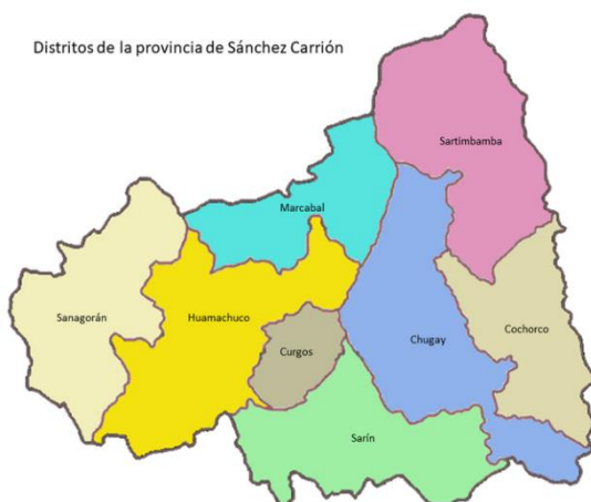
Distritos de la provincia de Sánchez Carrión