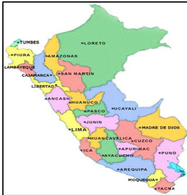
DEPARTAMENTO LA LIBERTAD