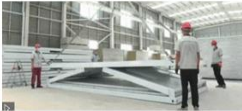
IMÁGENES REFERENCIALES DE LOS MODULOS PREFABRICADOS