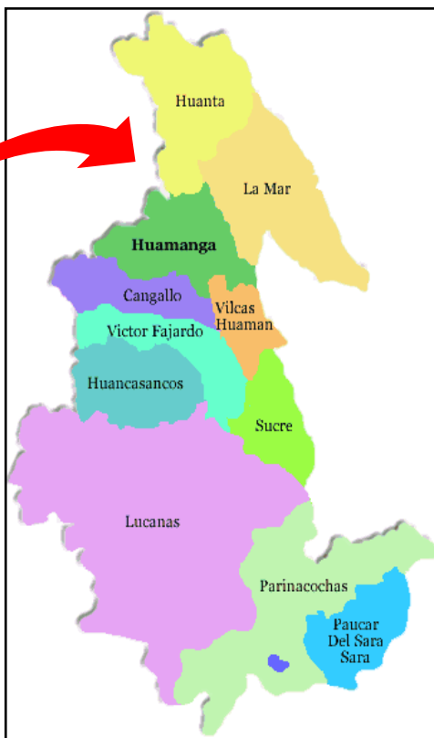
MAPA N° 03