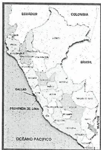
FIG. 01 Mapa de macro localización del Perú

El proceso consiste en el realizar la renovación y mantenimiento del sistema de suministro eléctrico de las áreas de recreación para el público en general del malecón turístico y recreativo villa atalaya de la ciudad de atalaya