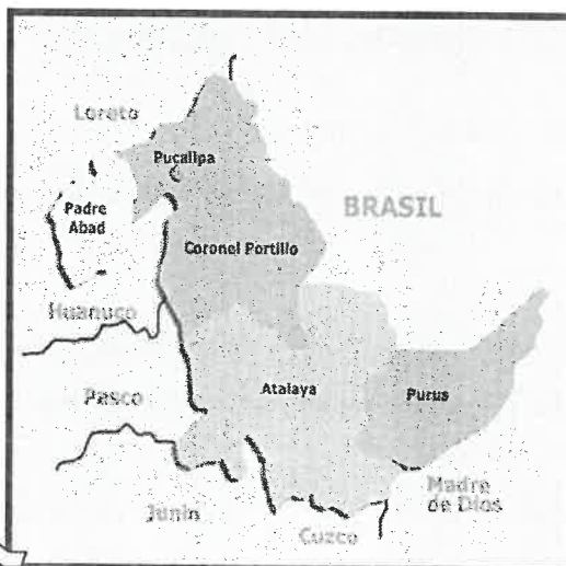
FIG. 02 Mapa macro localización del Departamento de Ucayali