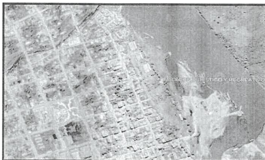
FIG. 04: Ubicación del proyecto, vista satelital