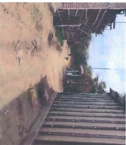
Imagen N° 05: Actualmente donde se realizará la intervención se encuentran a nivel de terreno natural (Pasaje S/N 02) son calles anchas de aproximadamente 3,90 metros, no cuentan con veredas peatonales, se propondrá reubicar postes, muros de medidores eléctricos.