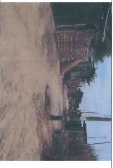
Imagen N° 04: Actualmente donde se realizará la intervención se encuentran a nivel de terreno natural (CALLE CONCEPCION) son calles anchas de aproximadamente 7 metros, no cuentan con veredas peatonales, se propondrá reubicar postes, muros de medidores eléctricos.