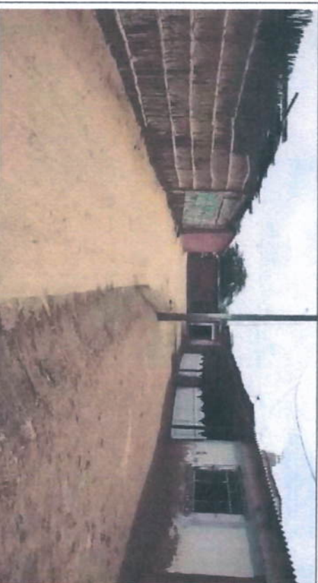
Imagen N° 01: Actualmente donde se realizará la intervención se encuentran a nivel de terreno natural (Pasaje S/N 01) son calles anchas de aproximadamente 4,6 00 metros, no cuentan con veredas peatonales.