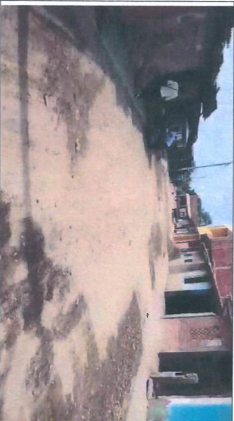
Imagen N° 02: Actualmente donde se realizará la intervención se encuentran a nivel de terreno natural (CALLE EL CONDOR) son calles anchas de aproximadamente 6,7 00 metros, cuentan con veredas peatonales en mal estado, se propondrá reubicar postes, muros de medidores eléctricos.