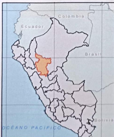
Gráfico N° 01: Localización del proyecto – País Perú