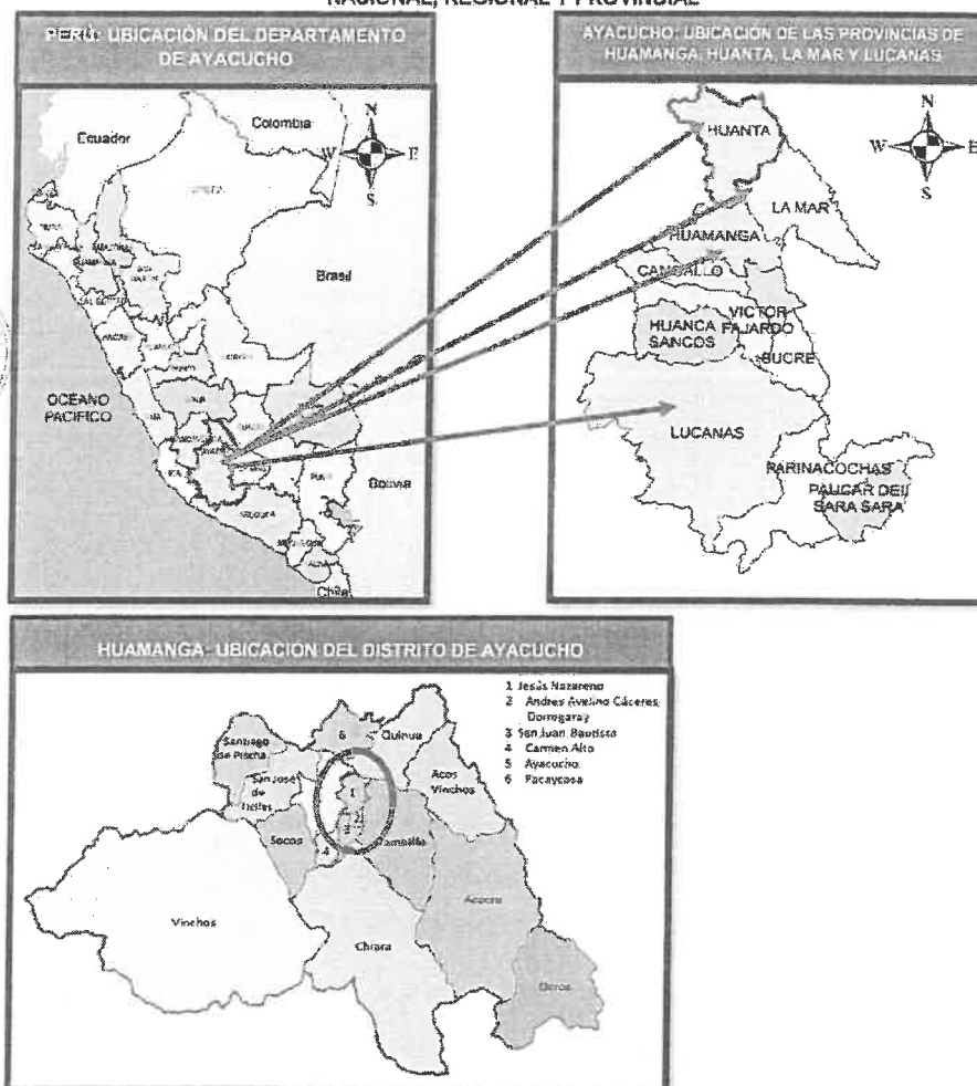
GRÁFICO N°01: MACRO LOCALIZACIÓN DEL PROYECTO - NIVEL NACIONAL, REGIONAL Y PROVINCIAL

TÉRMINOS DE REFERENCIA PARA LA CONTRATACIÓN DEL SERVICIO DE FORMULACIÓN DE LA FICHA TÉCNICA