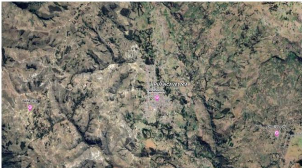
Imagen: Mapa del distrito de Acobamba.