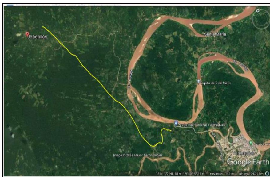
Yurimaguas Jeberillos - Ubicación de la carretera: Ubicación del proyecto

PROYECTO: “MEJORAMIENTO DEL SERVICIO DE TRANSITABILIDAD VIAL INTERURBANA EN LA VIA DE EVITAMIENTO - DESVIO RUTA N° LO - TRAMO: 107 YURIMAGUAS - JEBERILLOS, DISTRITO DE YURIMAGUAS DE LA PROVINCIA DE ALTO AMAZONAS DEL DEPARTAMENTO DE LORETO”.