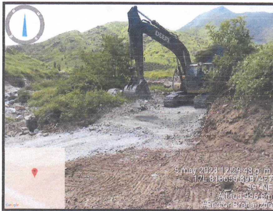
Foto N° 04: Vía vecinal Breña Isco - Zona: Caserío Breña Isco - Día: 05/05/2023.

Se realizará el removido de escombros y piedras, descolmatación, relleno con material granular en una altura de 0.20 m aproximadamente, entre otros trabajos que resulten necesarios para la rehabilitación del acceso.