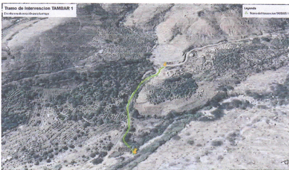
Imagen N° 04: Zona de Intervención TAMBAR 1