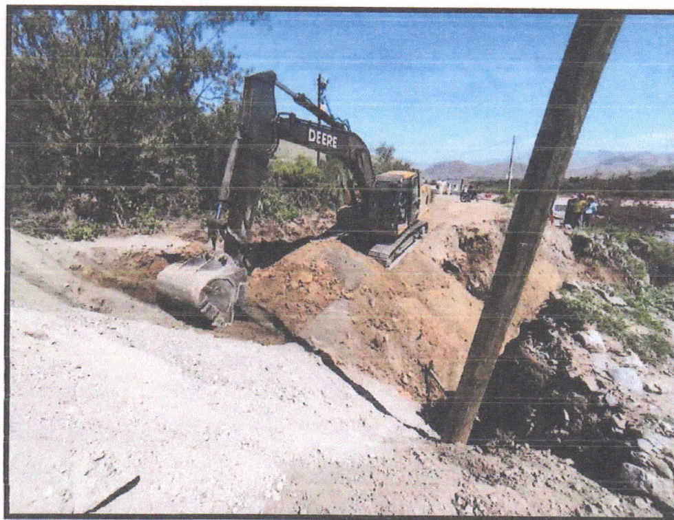
Foto N° 01: Vía vecinal Tambar - Zona: Caserío Tambar - Día: 22/04/2023.