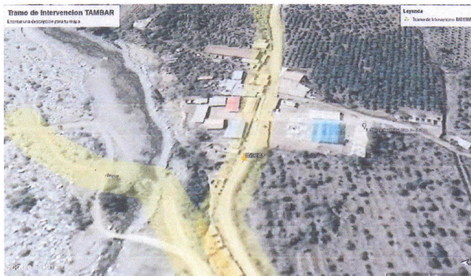
Imagen N° 02: Zona de Intervención TAMBAR