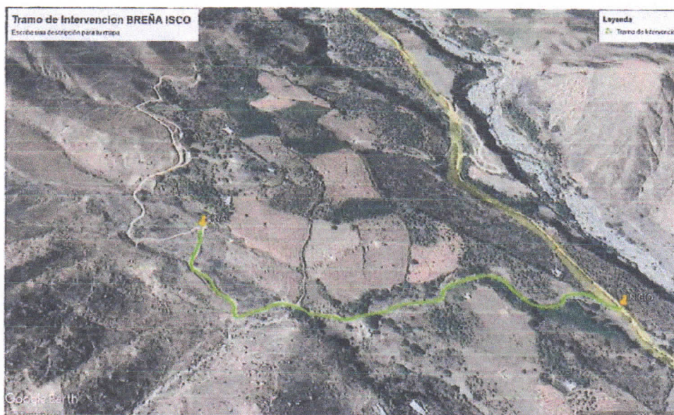
Imagen N° 03: Zona de Intervención BREÑA ISCO