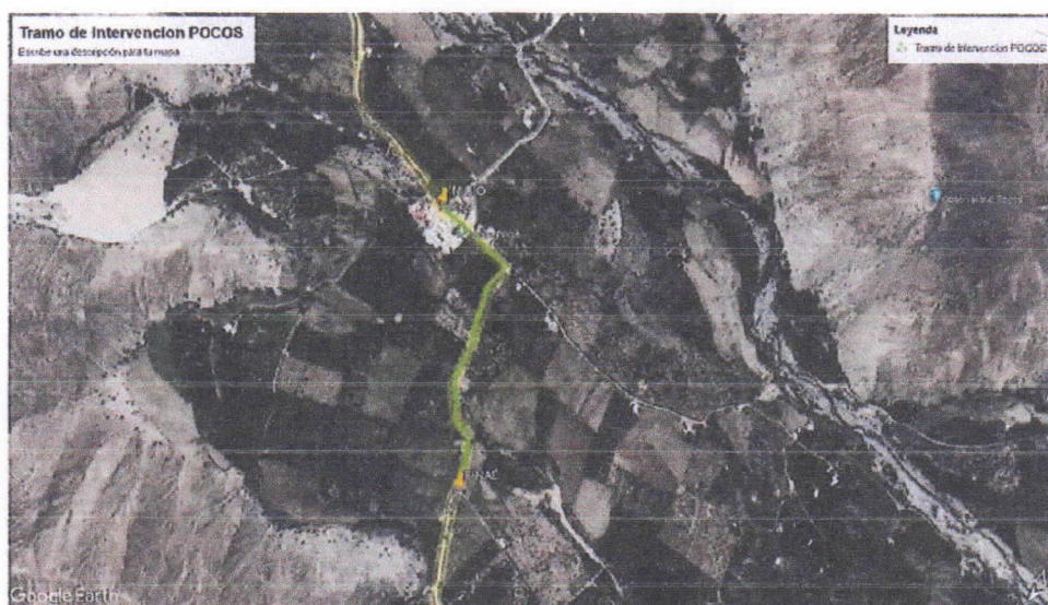
Imagen N° 01: Zona de Intervención POCOS