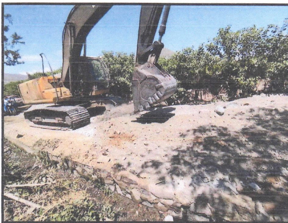
Foto N° 03: Vía vecinal Pocos - Zona: Caserío Pocos - Día: 28/04/2023.