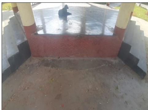
IMAGEN 3.1: DETERIORO DE LA INFRAESTRUCTURA

En la actualidad el C.P. Tambo Real Histórico, específicamente en la Plaza de Armas del Centro Poblado, cuenta con una infraestructura pública deteriorada en sus componentes estructurales y arquitectónicos; de esta manera con el presente estudio definitivo dotará de una infraestructura moderna y con los componentes que requieren en la actualidad el esparcimiento, así como una mejor relación con el medio ambiente. Así mismo mejorar los ornatos públicos para el uso inmediato de la población santeña y especialmente el C.P. Tambo Real Histórico.