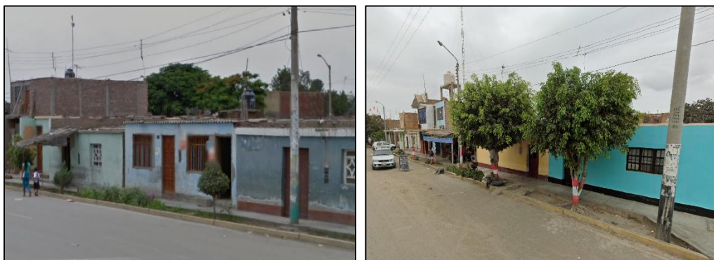
IMAGEN 2.5: VISTAS VIVIENDAS C.P. TAMBO REAL HISTORICO

El ambiente de influencia del proyecto, el material predominante en las paredes es el ladrillo, tal como se observa en la IMAGEN 2.5.