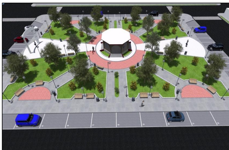
IMAGEN 5.1: DISEÑO ARQUITECTONICO DE LA PLAZA DE ARMAS DEL C.P. TAMBO REAL HISTORICO

El planteamiento general arquitectónico del proyecto se muestra a continuación: