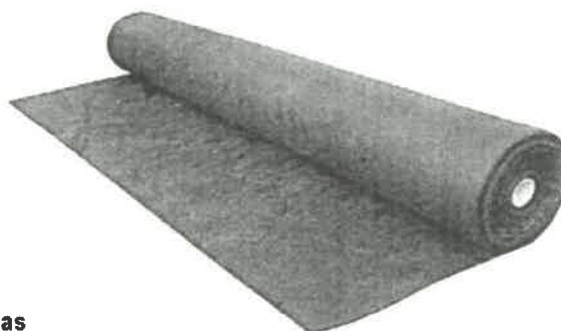
Gráfico N° 1: Rollo (Imagen referencial)