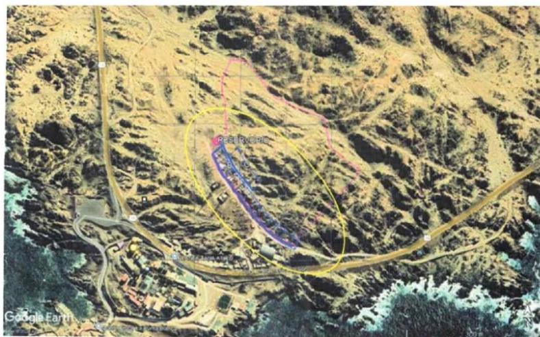
UBICACIÓN DEL ÁREA DEL PROYECTO

El proyecto se encuentra ubicado en el distrito de Atico, a una altitud promedio de 47 m.s.n.m., la distancia promedio desde el centro del distrito hasta el área del proyecto es de 10 klm en promedio, se llega en un tiempo estimado de 25 minutos, la vía se encuentra asfaltada hasta cierto tramo luego se continúa por una pequeña zona de trocha carrozable hasta el lugar del proyecto