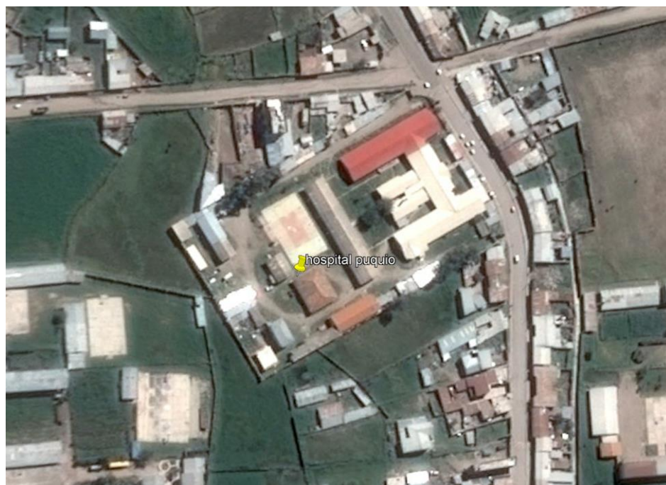
Fotografía N° 2: Vista aérea del Hospital de Puquio

El terreno mencionado presenta un área total de 13,883.40m 2 según partida registral de la SUNARP; según el levantamiento topográfico realizado en el mes de marzo del 2019 el terreno presenta un área de 14,025.83m 2 y un perímetro de 485.95 ml. El Hospital Felipe Huamán Poma de Ayala se encuentra en un terreno llano con pendientes suaves no mayores a 5%-6%