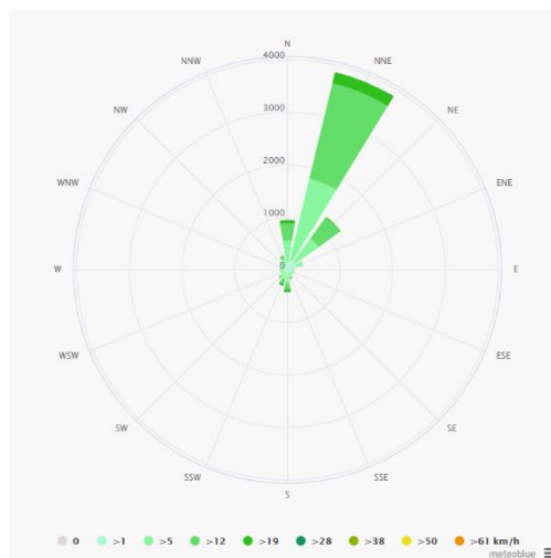
Gráfico N° 6: Rosa de vientos para Puquio

La direccione predominante de vientos es la que se indica en el siguiente gráfico, siendo predominantes los vientos de dirección NNE al SSW.