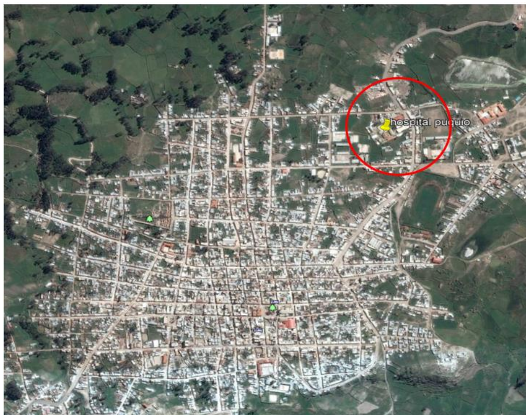
Fotografía N° 1: Vista aérea del Hospital de Puquio (círculo rojo)