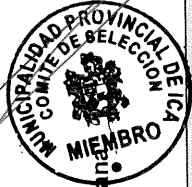
ANEXO 03: EVALUACIÓN TÉCNICA Y ECONOMICA CONCURSO PÚBLICO N° 07-2024-CS-MPI

"Año de la recuperación y consolidación de la economía peruana"